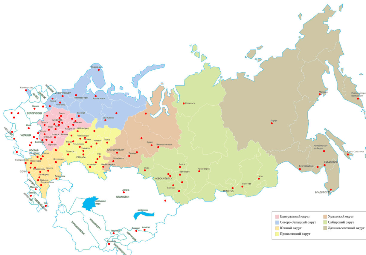
Рис. 3. Карта России и стран СНГ с обозначением городов, в которых открыты ВЧЗ ЭБД РГБ

С начала действия проекта и по настоящее время уже 353 Виртуальных читальных зала зарегистрировано почти во всех регионах России и в 10 странах СНГ: Беларусь, Украина, Казахстан, Молдова, Узбекистан, Азербайджан, Армения, Грузия, Кыргызстан, Таджикистан (рис.3).