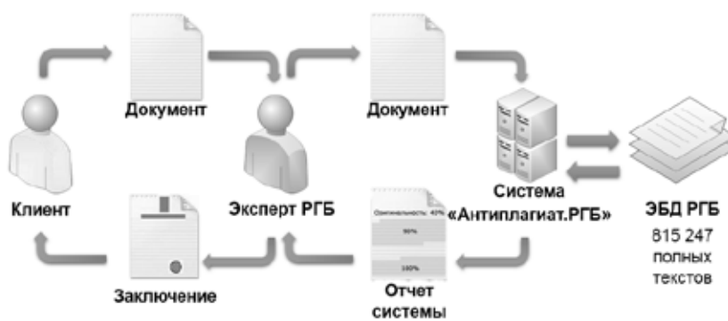
Рис. 3. Схема работы по проекту «Антиплагиат.РГБ»

В заключении обязательно указываются ФИО автора, данные