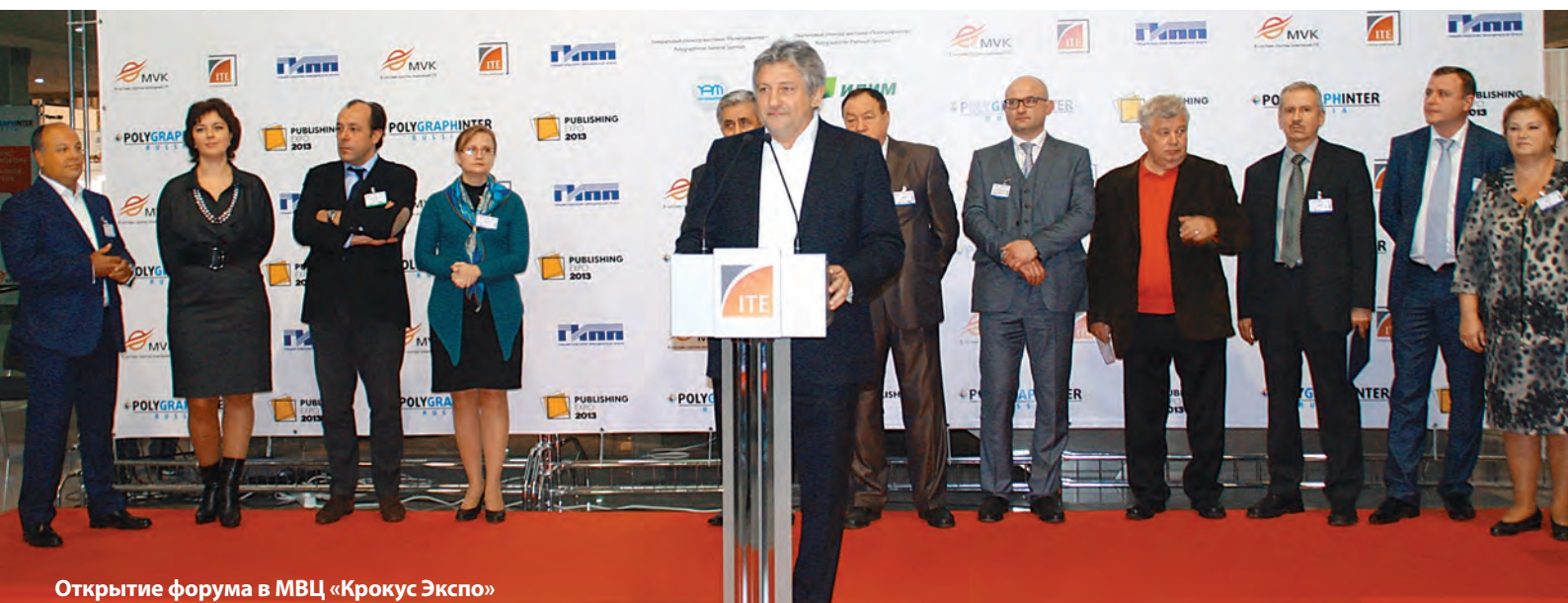
Открытие форума в МВЦ «Крокус Экспо»

Лейтмотивом форума редакторов стали действующие нормативные акты и законодательные инициативы, предусматривающие серьёзные изменения в системе создания и распространения контента. Правовой эксперт Общественной палаты России Борис ▶