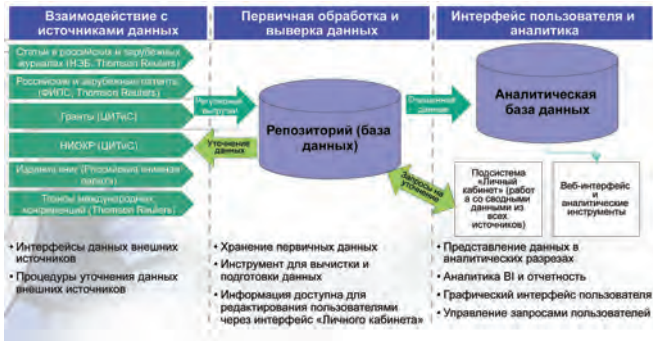
Рис. 1. Функционал Карты российской науки